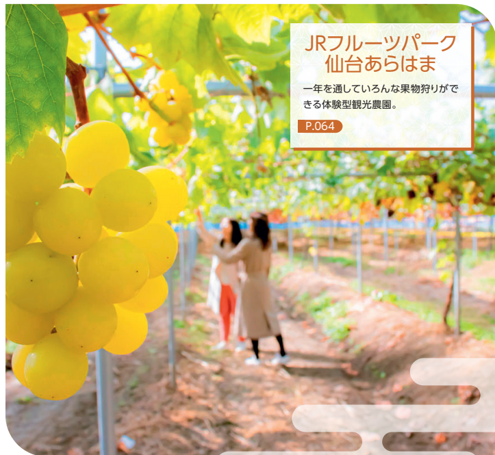
JRフルーツパーク 仙台あらはま 一年を通していろんな果物狩りができる体験型観光農園。 P.064