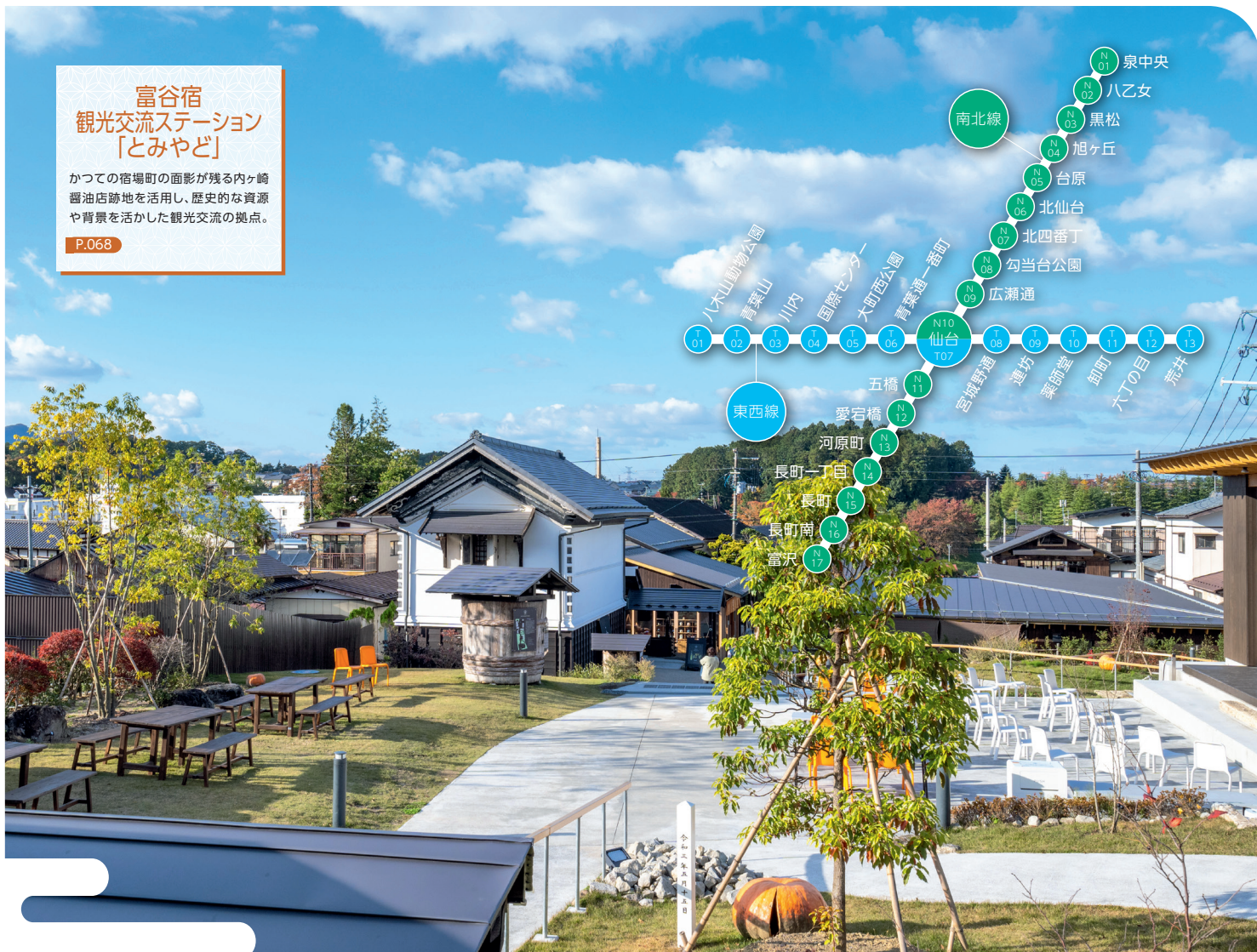
富谷宿 観光交流ステーション 「とみやど」 かつての宿場町の面影が残る内ヶ崎醤油店跡地を活用し、歴史的な資源や背景を活かした観光交流の拠点。 P.068