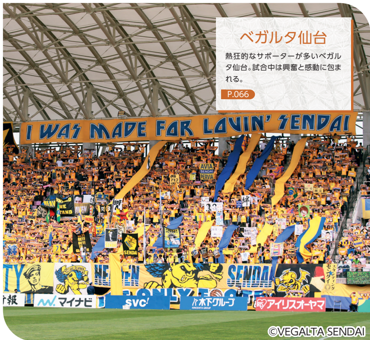
ベガルタ仙台 熱狂的なサポーターが多いベガルタ仙台。試合中は興奮と感動に包まれる。 P.066