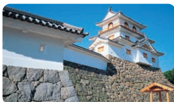
白石城 (白石市) [白石城(白石市)]

樹冰(又名雪怪)只有在符合了生長著冷杉、地形和氣象等幾項條件的場所才能看到，是非常珍貴的自然藝術。在宮城藏王澗川冰雪公園可以乘坐雪車“野怪號”體驗神秘的世界。