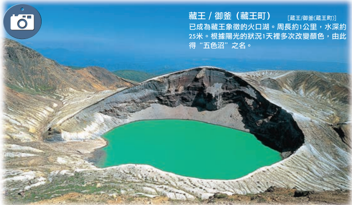
藏王 / 御釜 (藏王町) [藏王御釜(藏王町)] 已成為藏王象徵的火口湖。周長約1公里，水深約25米。根據陽光的狀況1天裡多次改變顏色，由此得“五色沼”之名。

作為仙台藩主伊達政宗的第一心腹片倉小十郎的城下町建設起來的白石。溫面、和紙、木偶等自古留傳下來的物產已成為特產。西有七宿，北有大河原、柴田、東有丸森等歷史城鎮，在藏王山麓的自然之中可以悠閒地享受溫泉的樂趣。