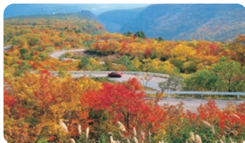
藏王回營線公路 (藏王町) [藏王回廊ライン(藏王町)]

宮城藏王烏帽子滑雪場是春季賞水仙的好地方。滑雪場完全被花覆蓋，4月下旬-5月中旬舉辦水仙節。