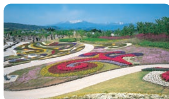
國營陸奥杜之湖畔公園 (川崎町) [國營陸奥杜之湖畔公園(川崎町)]

伊達家的重臣片倉小十郎的居城。1995年根據日本自古以來的建築樣式忠實地進行了復原。從天守閣可以將藏王群峰和市區盡收眼底。