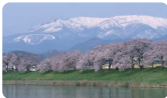
一目千株櫻 (大河原町、柴田町) [一目千本桜(大河原町、柴田町)]

在流淌於大河原町和柴田町中央的白石川の河堤上，連綿著約8公里的櫻花樹。在賞花季節夜晚也用燈光照明，櫻花節等也很熱鬧。縣內屈指可數的觀賞櫻花的著名景點。