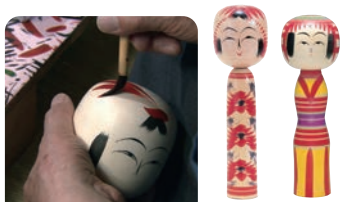
偶人 (藏王町、白石市) [偶人(藏王町、白石市)]