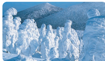
樹冰 (藏王町) [樹氷(藏王町)]

樹冰(又名雪怪)只有在符合了生長著冷杉、地形和氣象等幾項條件的場所才能看到，是非常珍貴的自然藝術。在宮城藏王澗川冰雪公園可以乘坐雪車“野怪號”體驗神秘的世界。