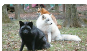
宮城藏王狐狸村 (白石市) [宮城藏王キツネ村(白石市)]

東北地區固有的鄉土玩具偶人，各地有獨特的形狀、表情、花紋。遠刈田體系偶人(藏王町)的特徵是軀體上畫了手、菊和梅的花紋、和藹的表情。彌治郎體系偶人(白石市)的特徵是寬闊的藍線線和像是帶了貝雷帽的頭部。還有可以體驗上彩的設施。