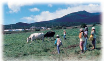
七日原高原 (藏王町) [七日原高原(藏王町)]

藏王山麓廣闊的高原。有著遼闊的牧草地帶，可以欣賞牛悠然自得地吃草的情景。使用新鮮的牛奶製作的乳製品作為土特產很受歡迎。並且還可以體驗擠奶和製作乳製品。