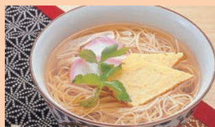
溫面 (白石市) [温麺(めん、白石市)]

與和紙、葛並稱為“白石三白”的白石特產面。據說起源於為了患胃病的父親，不使用油，只用麵粉和鹽水製作的麵條，因為是出於溫馨的關係而做成的，所以被稱為“溫面”。其魅力在於易消化、營養豐富、獨特的風味。熱吃、涼吃皆宜。